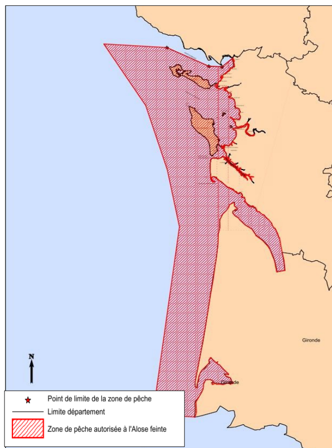
Carte 1 : Zone de pêche autorisée pour l'alose feinte

Crustacés : Pêche interdite dans le cantonnement au nord ouest de l'île de Ré (carte 3).