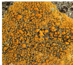
fig 2 : Lichen