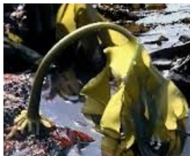
fig1: Goémon de rive

Lichen : Organisme composé (algue et champignon) progressant lentement à la surface des rochers soumis aux marées (fig 2).